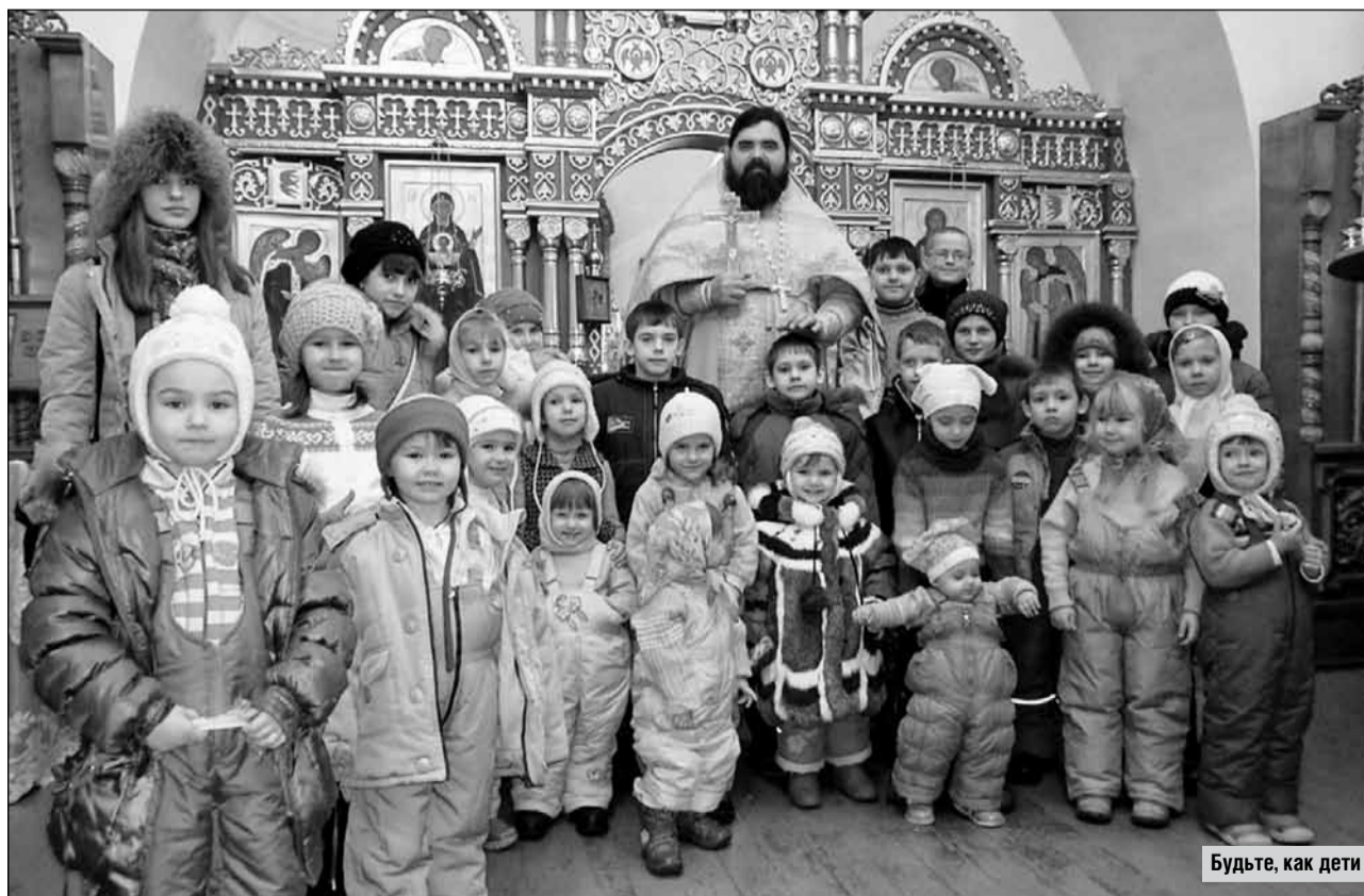
Будьте, как дети