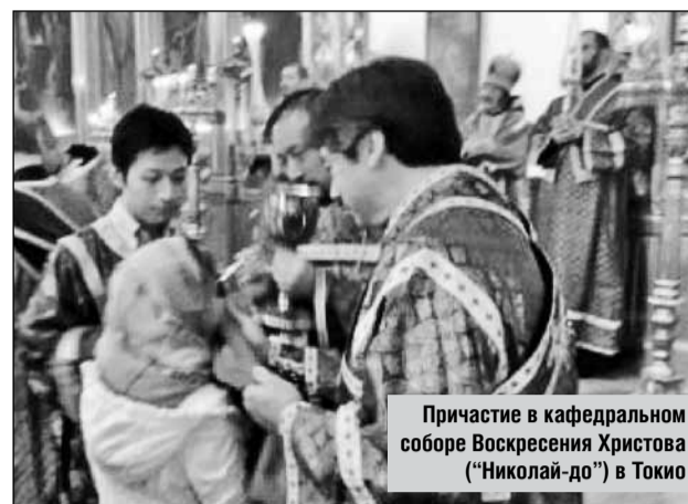
Причастие в кафедральном соборе Воскресения Христова («Николай-до») в Токио