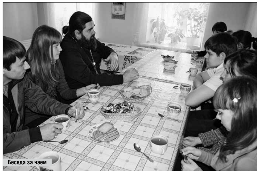
Беседа за чаем