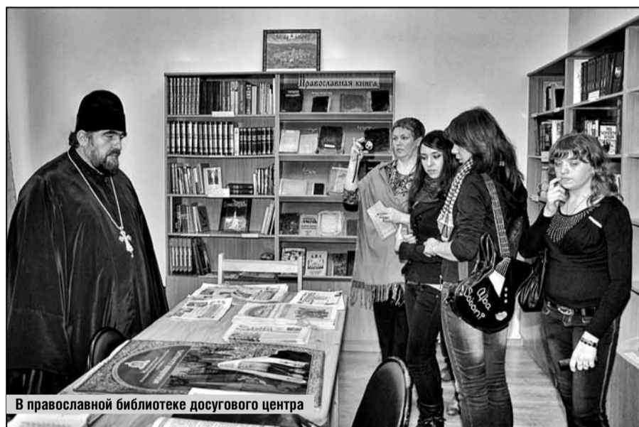
В православной библиотеке досугового центра

В детском православном досуговом центре во имя святителя Иоасафа Белгородского состоялась мероприятия, посвященные Дню православной книги.