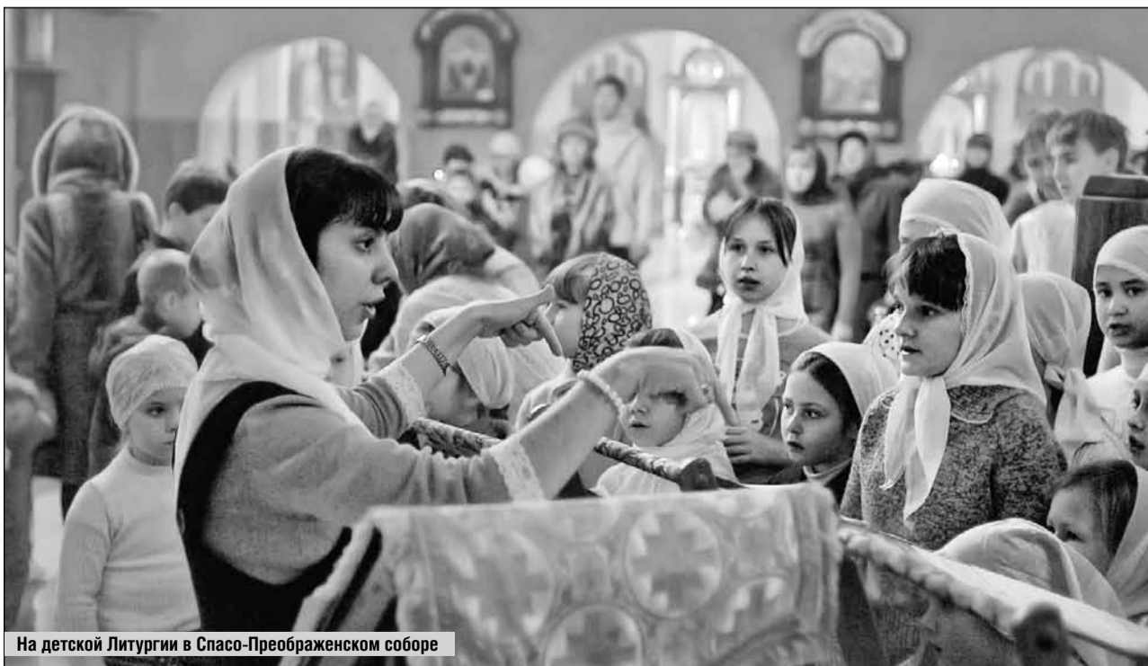
На детской Литургии в Спасо-Преображенском соборе