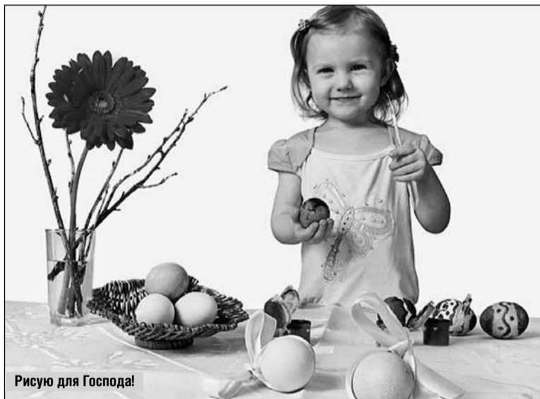
Рисую для Господа!

Творог протереть через сито либо пропустить через мясорубку, добавить размягченное (но не растопленное) сливочное масло, орехи, изюм, цукаты и перемешать. Добавить взбитые яйца. Выложить массу в пасочницу – специальную разборную форму, которую можно приобрести на православных ярмарках (если пасочницы нет, то можно использовать новый цветочный горшок). Форму застелить марлей, сложенной в пять сло-