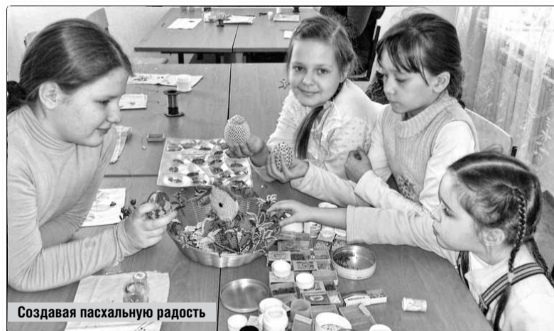
Создавая пасхальную радость