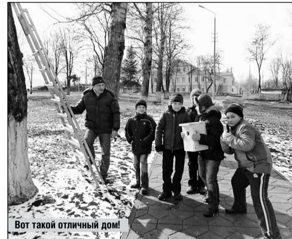
Вот такой отличный дом!